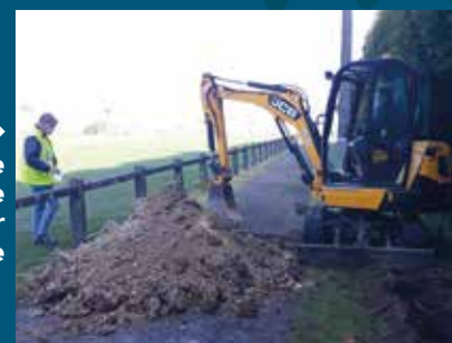
Installation ▶ d'un câblage électrique autour du stade