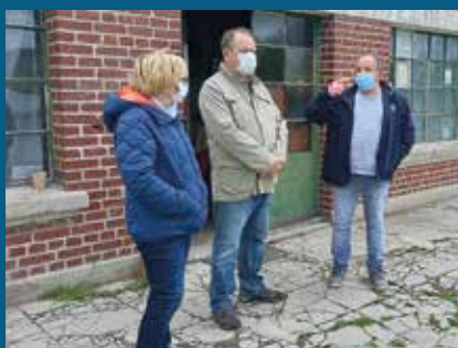
▲ Découverte du sentier nature avec les Pêcheurs Péronnais