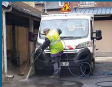
▲ Nettoyage de la cour intérieure de la salle Edouard Dacheux