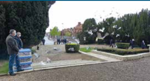
▲ Cérémonie du 8 mai