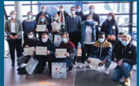
▲ Remise des BIA au lycée Pierre Mendès France