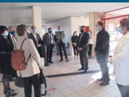
▲ Visite de la maison France Services