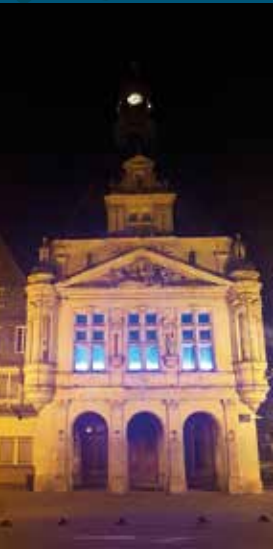
◀ L'hôtel de ville illuminé en bleu pour l'opération Mars Bleu