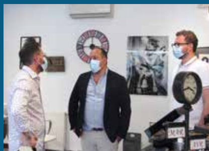
▲ Rencontre avec les commerçants