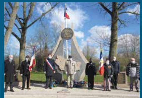
▲ Cérémonie en hommage aux victimes civiles et militaires de la guerre d'Algérie et des combats en Tunisie et au Maroc